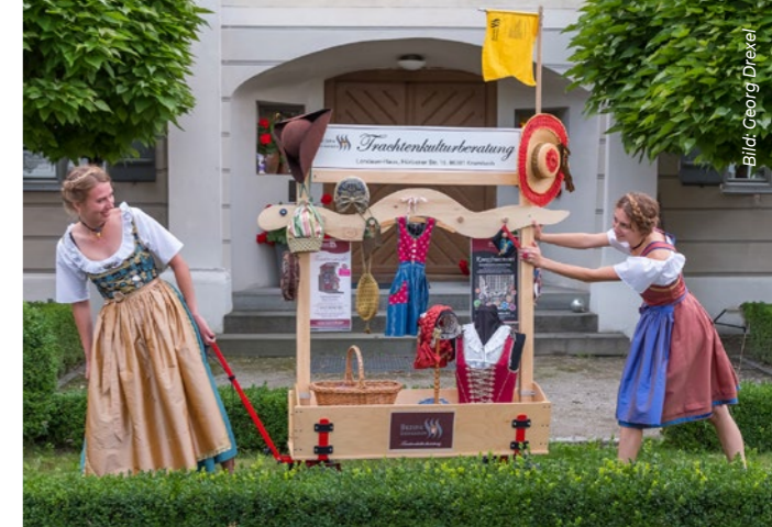
Die Trachtenkultur-Beratung des Bezirks Schwaben lädt ein zum 22. Schwäbischen Trachtenmarkt in Krumbach.