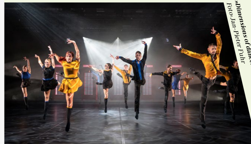
»Dimensions of dance- Part 3« Ensemble