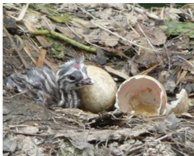
Ein Haubentaucher Junges frisch geschlüpft. Haubentaucher mit Jungen im Gefieder. Es spitzt nur noch der Kopf heraus.

Gerhard Menzels Filmaufnahmen entstanden an Seen im Augsburger Land. Es begann an den Mühlhauser Seen mit einem Schwanennest auf dem ein Schwan saß. Brütete er? Diese Frage machte ihn neugierig. Nach der ersten Kontaktaufnahme mit den Höckerschwanen rückte er jeden Tag näher an das Nest heran und konnte sich nach einer Woche ohne zu stören frei am Nest bewegen. Ständig wird daran gebaut und zwischendurch konnte er sogar eine Paarung beobachten. Gerhard Menzel verfolgte dieses Geschehen mit der Kamera, 45 Tage am Nest bis alle Jungen schlüpften. Bald bemerkte er, dass man in einem Jahr keinen Film über Schwäne fertigstellen kann und er beobachtete und filmte noch zwei weitere Jahre das Leben der Schwäne.