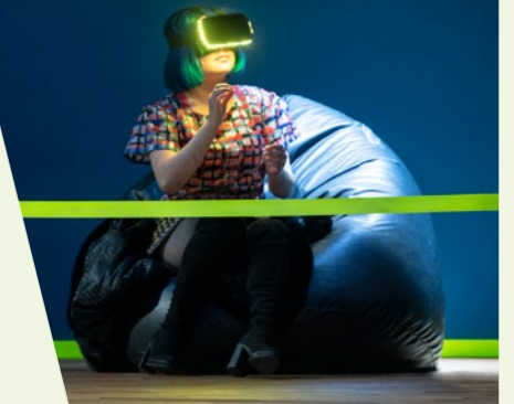
»Orfeo ed Euridice« Elif Esmen