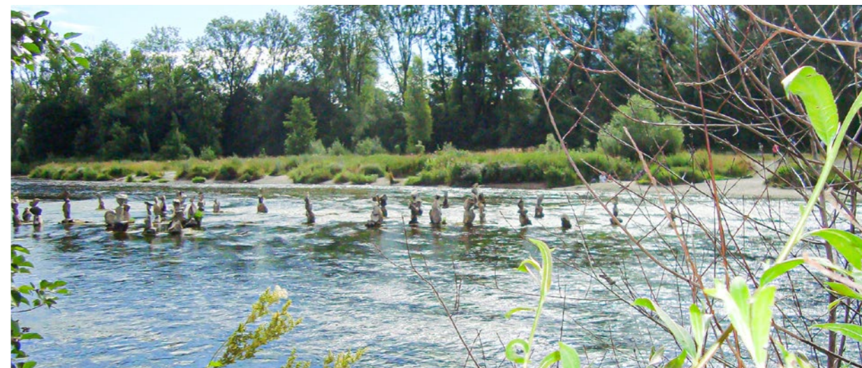
„Die Yoga-Damen“ in der Wertach an der Wertachau Göggingen

Früher dienten sie zur Wegfindung in steilem Gelände oder markierten einen besonderen Punkt. Doch steckt auch eine Menge Aberglaube hinter den durch Menschenhand gestapelten Steinen. Vor boshaften Trolen möchte man in Skandinavien beispielsweise Wanderer schützen. In Tibet huldigt man den guten Geistern und erklärt den bösen Gesellen deutlich durch die Steinmarkierung – ab hier seid ihr unerwünscht. Auch in Augsburg an der