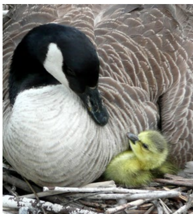
So nah lassen Wildvögel normalerweise niemanden an ihr Nest.

Er dokumentiert Flora und Fauna im Wittelsbacher Land mit der Filmkamera. Besonders oft und intensiv beobachtet der Anwaltlinger, Schwäne und Wasservögel. Er gewinnt ihr Vertrauen und immer öfter namhafte Preise.