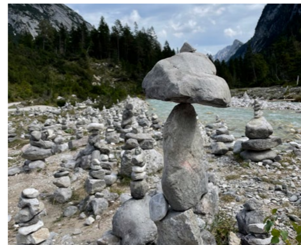
Hinterautal im Karwendelgebirge

Steine stapeln liegt im Trend. Sie sind hübsch anzusehen und jeder scheint mit zu bauen. Überall in den Bergen oder auch teilweise an Seen oder Steinstränden sind sie zu sehen, die Steinmännchen, auch Steinmandl oder Steindauben genannt.