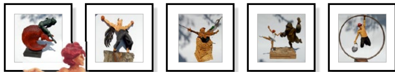
Kunstdrucke im Rahmen 30x30 cm Petrus Einzelbild € 90

Erika Berckhemer | Edyta Deniz-Deluga Monika Wex | Petrus | Peter Schlichtherle Robert Wilhelm | Christine Oster