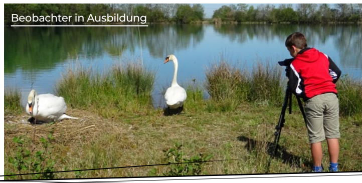
Beobachter in Ausbildung