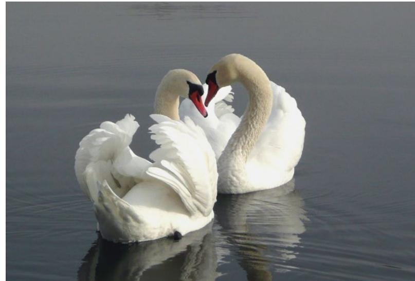
Bindung ein Leben lang

Die Schwanen-Paare binden sich für das ganze Leben. Bei einer Gruppe von Höckerschwanen konnte festgestellt werden, dass von den erfolgreich brütenden Tieren 97 % im Folgejahr mit demselben Partner brüteten. Dass sich Paare trennen, ist demnach extrem selten. Man stellte z. B. bei einem 27-jährigen Zwergenschwan eine Paarbindung von 19 Jahren fest. Es ist also sehr schwierig für ältere Schwäne, die ihren Partner verloren haben, einen neuen Lebensgefährten zu finden.